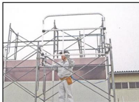
4. 先行手すり枠の下部固定金具にクサビを打ち込んで固定します。もう一方の下部固定金具を同様にクサビを打ち込んでセット完了。