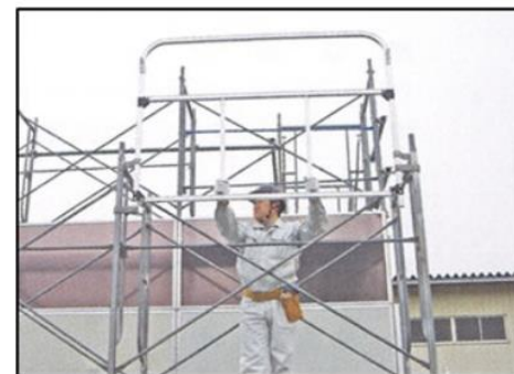
3. 上体を起こします。