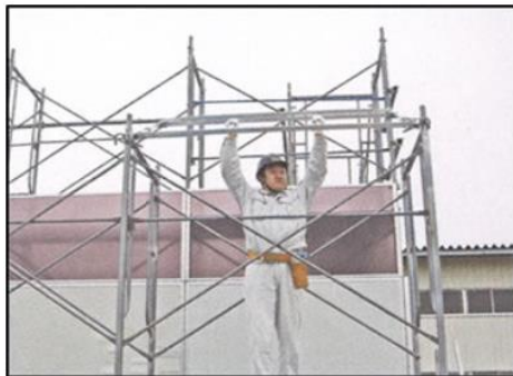
1. 先行手すりの枠の上部位置決め金具を枠組の横架材に乗せます。