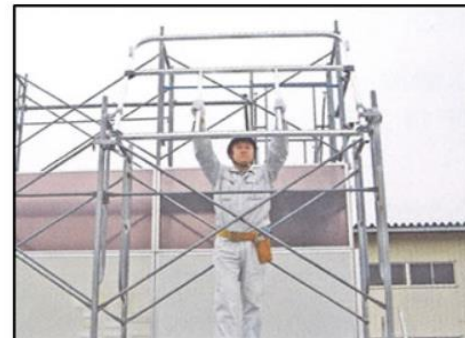
2. 先行手すり枠の下部固定金具が枠組の脚柱にセットできる位置まで半転させます。